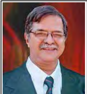
ಚೊ ದೊ ಜೆರಿ, ನಿಡ್ಲೊಡಿ

(ಆಧಾರ್: ದೊ.ರೆ.ಮಿ.ಫಾ-ರಾಕ್ಲೊ ಪ್ರಕಾಶಾನ್-ಬರಯ್ಲಾರ್-ಚೆರಿ ಡಿ ಮೆಲ್ಲೊ, ದಾಯ್ಜಿ ವರ್ಡ್ ಅಂತರ್ವಳ್, ಮಿಕ್‌ಮ್ಯಾಕ್ಸಿ ಧುವ್-ಕರೀಶ್ಯಾನ್ ದಿಲ್ಲಿ ಮಾಹತ್ ಆನಿ ತಸ್ವಿರ್)