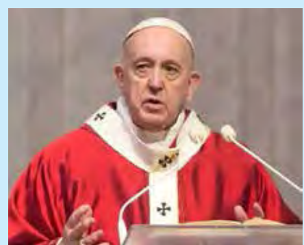
- ಪಾಪಾ ಫ್ರಾನ್ಸಿಸ್

"ದೇವಾನ್ ಮೊಗಾನ್ ದೆಣೆಂ ಜಾವ್ನ್ ದಿಲ್ಲ್ಯಾ ಸೃಷ್ಟೆಂತ್ ತುಮಿಂ ಖಾಂವ್ಚೆಂ-ಸೆಂವ್ಚೆಂ ಖಾಣ್ ಉದಾಕ್ ತೆಂ ತುಮ್ಚ್ಯಾ ಕಷ್ಟಾಂ-ವಾಂವ್ಪಿಚಿಂ ಕೂಡಿಕ್ ಬೆಸೊರ್ ಗಾಲ್ನ್ ಜೊಡುಲ್ಲೆಂ ಜಾಯ್ ಶಿವಾಯ್ ಪೆಲ್ಯಾಂಚಿಂ, ದುಬ್ಯಾಂಚಿಂ ಅಪಹರ್ಸುನ್ ಲುಟುನ್ ಖಾಂವ್ಚೆಂ ತೆಂ, ನಿರ್ಗತಿಕ್ ಅಭಲ್ ದೊಳ್ಯಾಂಚಿಂ ದುಃಖಾಂ ಜಾಯ್ನಾಯೆ!"