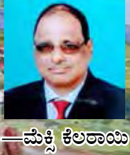
— ಮೆಕ್ಸಿಕೊ ಕಲರಾಯಿ

ತ್ಯಾ ವ್ಹಡ್ ಜಯ್ ಧಾಟ್ ರಾನಾಂತ್ ತಳ್ವಾದೆಗನ್ ಆಸ್ಲಲ್ಯಾ ರುಕಾ-ರುಡಾಂ ಮಧೆಂ ಸಭಾರ್ ಸೊಂಸೆ ಜಿಯೆವ್ನ್ ಆಸ್ಲೆ. ಧೈಂಸರ್ ತಾಂಕಾಂ ಬರೆಂ ಖಾಣ್ ಮೆಳ್ತಾಲೆಂ ಜಾಲ್ಲ್ಯಾನ್ ತಾಂಚೊ ಸಂಖೊ ಚಡಾತ್ತ್ ಆಯ್ಲೊ.