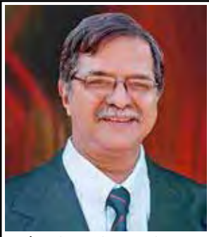
ದೊ ಜೆರಿ, ನಿಡೊಡಿ

(ಆಧಾರ್: ರಾಕ್ಲೆ ಅಮೃತೋತ್ಸವ್ ಅಂಕೊ-ಡಾ| ಎಡ್ಡರ್ಡ್ ನಜೆತ್, ಕುಟಾವ್ - ಜುಲಾಯ್ 21, 2012-ಡೊಲ್ಲಿ ಕಾಸ್ತಿಯಾ, ಅಂತರ್ ಜಾಳ್ ಆನಿ ಜೆರಿ ಕುಲೈಕರಾಚಿಂ ಪುಸ್ತಕಾಂ)