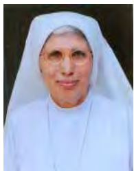
ಬೆಥನಿ ಭಯ್ಣೆ ಮಾರಿ ಆಂಚ್ ಬೆಥನಿ ಕಾನ್ವೆಂಟ್, ಬೆಂದೂರ್

ಪೂಣ್ ಆರಂಭ್ಯೊ ಅಂತ್ಯೊ ಕೆದಿಂಚ್ ನಾ ತುಕಾ! ಮೆಲ್ಯಾ ನಂತರ್ ಸರ್ಗಾರಾಜಾಚೆಂ ಸಾಸಾಣ್ ಜಿವಿತ್ ದಿ ಮ್ಹಾಕಾ ನಿರಂತರ್ ಆನಂದಾನ್ ಜಿಯೆವ್ನ್, ಅರ್ಗಾಂ-ಸ್ತುತಿ ಗಾವುಂಕ್ ತುಕಾ!