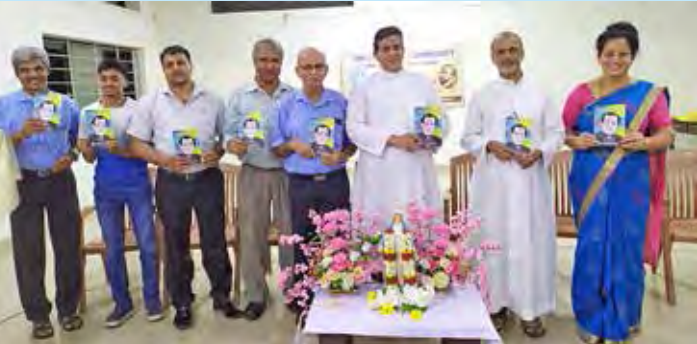
ಸಿ.ಎಲ್.ಸಿ. ಸಾಂ. ಇನಾಸ್ ಮಂಗ್ಳುರ್ ದಿಯೆಸೆಜಿಂತ್ ಲೊಯೊಲಾನ್ ಲಾಯಿಕಾಂ ಪಾಟ್ಲೊ 60-70 ವರ್ಸಾಂ ಖಾತಿರ್ ಘಡ್ಲೊ ಸಗ್ಳ್ಯಾ ಥಾವ್ನ್ ಸಭಾರ್ ಫಿರ್ಗಜಾಂನಿ ಸಂಸಾರಾಂತ್ ವಿಸ್ತಾರುನ್ ಆಸಾ. ಆಸಾ.