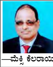
— ಮೆಕ್ಸಿಕೊ ಕೆಲರಾಯಿ

ತಸಲ್ಯಾ ಸಂದರ್ಭಾಂನಿ "ಅಯ್ಯೋ ಆಪುಣ್ ಪಡೊನ್ ಉರುಲ್ಲಾಂನಿ ಹಾಸೊಂಕ್ ಜಾಂವ್ಬರಿಂ ಜಾಲೆಂ ನೇ ಮ್ಹಣ್ ಬೆಜಾರಾಯೆನ್ ರಾಂವ್ಚಾ ಬದ್ಲಾಕ್ ವೆಗ್ಗಿಂಚ್ ಸುಧಾರ್ನ್ ಉಟಿಂ ಬೊರೆಂ ನೇ" ಮ್ಹಣಾಲೊ. ಅಸಲೆಂಚ್ ಏಕ್ ಘಡಿತೆ ಕ್ರಿ.ಶ. ಧಾ-ವ್ಯಾ ಶತಮಾನಾಂತ್ ಇಂಗ್ಲೆಂಡಾಂತ್ ಘಡ್ಲೆಂ. ತವಳ್ಚೊ ರಾಯ್ ವಿಲಿಯಮ್ ದಿ ಕಾನ್ಸರಾರಾನ್ ಹೇಸ್ಪಿಂಗ್ ಶಹರಾಚೆರ್ ಧಾಡ್ ಘಾಲಿ. ತೊ ಆಪ್ಲ್ಯಾ ಘಾವ್ಣೆಚಾ ಮುಖ್ಯಾನ್ ಮಾರ್ಗದರ್ಶನ್ ದೀವ್ನ್ಚ್ ವೆತಾಲೊ. ಎಕಾಚ್ಯಾಣ್ ತೊ ಪಾಂಯ್ ನಿಸರ್ನ್ ಪಡ್ಲೊ. ವೊಮೊಚ್ ಪಡ್ಲಾನ್ ಮುಖಮಳ್ ಆನಿ ಆಪ್ಣಾಚಿ ಹಾತ್ ಧರ್ಣಿಕ್ ಆಪ್ಲಾಲೆ. ಧರ್ಣಿಚಿ ಧುಳ್ ತಾಚಾ ಮುಖಮಳ್ ಆನಿ ಹಾತಾಂಕ್ ಲಾಗ್ಲಿ. ಇಂಗ್ಲೆಂಡಾಚಾ ಲೊಕಾಕ್ ತಿಕ್ಕೆ ಫಿತಿಪ್ಪಣಾಂ ಚಡ್ಚ್ಚ್ ಸೈನಿಕ್ ಸಗ್ಳೆ "ಅಯ್ಯೋ ಹೆಂ ಆಮ್ಕಾಂ ಬೊರೆಂ ನ್ಹಯ್. ರಾಯಾನ್ಚ್ ಪಡ್ಲೆಂ ಮ್ಹಳ್ಳಾರ್ ಕಿತೆಂ? ಮುಖಾರ್ ಜಾಂವ್ಚಿಂ ಸಲ್ವಣಿ ದಾಕೊವ್ನ್ ದಿಲ್ಲೆಂ ಪಾಡ್ ಘಡಿತೆ ಪಾಡ್ ಘಡಿತೆ ಹೆಂ. ಆಮಿಂ ಪಾಟಿಂ ವೆಚಿಂಚ್ ಬರೆಂ" ಮ್ಹಣ್ ಎಕಾಮೆಕಾ ಉಲಂವ್ಲಾಂ. ಹೆಂ ಆಯ್ಕಲ್ಯಾ ರಾಯ್ ವಿಲಿಯಮ್ಚ್ ಬರೆಂ ಲಾಗ್ಲೆಂ ನಾಂ. ಸಕಾರಾತ್ಮಕ್ ಚಿಂತ್ಪಾಚೊ