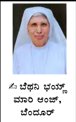
✠ ಬೆಥನಿ ಭಯ್ ಮಾರಿ ಆಂಜ್, ಬೆಂದೂರ್

ತೊ ಉದ್ಯಾಂತ್ಲೊ ಕಾಡ್ನ್ ಯೆಕಾ ಕೊರ್ಪರಲಾರ್ (ಕುಮ್ಗಾರ್ ಹ್ಯಾ ಧವ್ಯಾ ತುವಾಲ್ಯಾರ್ ದವರ್ತಾತ್) ದವರ್ನ್ ತೊ ಪರ್ತ್ಯಾನ್ ತಾಬೆರ್ನಾಕ್ಲಾಂತ್ ದವರ್ಲೊ. ತ್ಯಾ ಘಡಿತಾಚಿ ಪರಿಕ್ಲಾ ಕರುಂಕ್ ಬಿಸ್ಪಾನ್ ಯೇಕ್ ಸಮಿತಿ ರಚ್ಲಿ. ಫೊರೆನ್ಸಿಕ್ ಮೆಡಿಸಿನ್ ಡಿಪಾರ್ಟ್ ಮೆಂಟಾಚ್ಯಾ ವೊರೊಕ್ಲೋವ್ ವೈಜ್ಞಾನಿಕ್ ಸಂಶೋಧನಾಚ್ಯಾ ತಜ್ಞ್ ಪಂಗ್ಡಾನ್ ತಾಚಿಂ 15 ಸ್ಯಾಂಪಲಾಂ ಪರಿಕ್ಲಾ ಕರ್ನ್, 2014 ಜನವರಿ 26 ತಾರಿಕೆರ್ ತಾಚಿ ವರ್ಧಿ ದಿಲಿ. ತ್ಯಾ ವರ್ಧೆಂತ್ ಅಶೆಂ ಬರವ್ನ್ ಆಸ್ಲೆಂ: