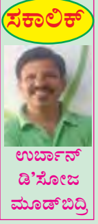
ಸಕಾಲಿಕ್ ಉರ್ಬಾನ್ ಡೆ'ಸೋಜ ಮೂಡ್‌ಬದಿ

ಮೆಳ್ಳಿ. ಹೆಂ ಚುನಾವ್ ಲಗ್ವೆಕ್ ಮಹಿನ್ಯಾಂ ಚಲ್ಲೆಂ. ತಿಸ್ರೆಂ, ಮಾರ್ಚ್ ಮಹಿನ್ಯಾಂತ್ ಗುಜರಾಂತ್ಲಾ ನರೇಂದ್ರ ಮೋದಿ ಚಿಂಟಾ ಮೈದಾನಾಚೆರ್ ಸುಮಾರ್ 1,30,000 ಲೋಕಾಕ್ ಭಾರತ್ ಆನಿ ಇಂಗ್ಲೆಂಡಾ ಮಧೆಂ ಜಾಲ್ಲ್ಯಾ ದೋನ್ ಕ್ರಿಕೆಟ್ ಖೆಲ್ ಪಳೆಂವ್ಕ್ ಆವ್ಕಾಸ್ ದಿಲ್ಲೊ ಕೋವಿಡಾಕ್ ಫಾಯ್ದಾಂಚೊ ಜಾಲೊ. ಪೂಣ್ ಇತ್ಲ್ಯಾ ಭಾರತ್ ವೈರಾಸಾಚಾ ಪ್ರಭಾವಾನ್ ಕಷ್ಟಾತಾಲೆಂ. ಎಪ್ರಿಲ್ ಮಹಿನ್ಯಾ ಮಧೆಂಚ್ ದಿಸಾಕ್ ಸುಮಾರ್ ಏಕ್ ಲಾಖ್ ಲೋಕ್ ಪಿಡೆಕ್ ವಲಗ್ ಜಾಲೊ. ಆನಿ ಎಕಾ ದಿಸಾ, ಆಯ್ತಾರಾ ಸುಮಾರ್ 2,70,000 ಲೋಕಾಕ್ ಕೊರೋನಾನ್ ಧರ್ಲೆಂ ಆನಿ ಸುಮಾರ್ 1,600 ಲೋಕ್ ಮರಣ್ ಪಾವ್ಲೊ. ಆನಿ ಹೊ ಸಂಖೊ ಮೇಯಾಂತ್ ಆನಿ ಜೂನಾಂತ್ ಚಡ್ಲೊ ಆನಿ ಸರ್ಕಾರಿ ಆನಿ ಖಾಸ್ತಿ ಆಸ್ತೆನಿ ಬೆಡ್ಡಾಂ ಮೆಳನಾಸ್ತಾನಾ ಕಿತ್ಲೊಚೊ ಲೋಕ್ ಮೆಲೊ. ಅಕ್ಟಿಜನ್ ಸೆವಾ ನಾಸ್ತಾನಾ ಹಜಾರೊಂ ಮೊಡಿಂ ಜಳೊಂಕ್ ಗೆಲಿಂ. ಪರಿಸ್ಥಿತಿಚೊ ಫಾಯ್ದೊ ಉಟವ್ನ್ ಪಯ್ಲೊ ಕರ್ಚೊ ದಂದೊಚ್ ಸುರು ಜಾಲೊ.