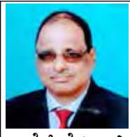
— ಮೆಕ್ಸಿಕೊ ಕಲರಾಯಿ

ದುಸ್ರೆ ದಿಸಾ ಇನ್ನೊಲ್ ಆರಂಭ್ ಜಾಲೆಂ. ಲೆಕ್ಕಾಚೊ ಮೇಸ್ತಿ ಕ್ಲಾಸಿ ಭಿತರ್ ಆಯಿಲ್ಲೆಂಚ್ ಹೊ ಭುರ್ಗೊ ತ್ಯಾ ಮೇಸ್ತಿಲಾಗಿಂ ವಚೊನ್ ಹಾತ್ ಮುಗ್ಡುನ್ 'ಮೇಸ್ತಿ ತುಮಿಂ ದಿಲ್ಲ್ಯಾ ಇನಾಮಾಕ್ ಹಾಂವ್ ಫಾವೊ