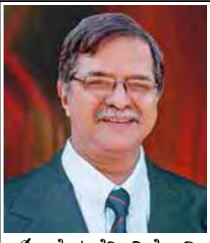
ದೊ ಜೆರಿ, ನಿಡೊಡಿ

1994 ಇಸ್ವೆಂತ್ ತಾಚ್ಯಾ ಸಾಹಿತ್ ವಾವ್ರಾಕ್ 50 ವರ್ಸಾಂ ಸಂಪ್ರಾನಾ, ಲೊಕಾನ್ 'ಕೊಂಕ್ಣಿ ಕಲಾ ಭೂಷಣ್' ಮ್ಹಳ್ಳೆಂ ಬಿರುದ್ ತಾಕಾ ದಿಲಾಂ.