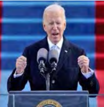
ಆತಾಂ ಉಬಿಂ ಆಸಾತ್ ಸಬಾರ್ ಸವಲಾಂ ಮ್ಹಣ್ಣೆತ್. ಟ್ರಂಪಾನ್

ಸಬಾರಾಂಚಾ ಮತಾ ಪ್ರಕಾರ್ ಫಕತ್ ಜಾಣ್ವಾಚಾ ಮಾತ್ ನ್ಹಯ್, ಸಂಸಾರ್ಭರ್ ಆಸ್ಲಲ್ಯಾ ವಿವಿಧ್ ದೇಶಾಂಚಾ ಪುಡಾರ್ಯಾಂ ಥಾವ್ನ್ಯಾಂ, ಆಮೇರಿಕಾಚೊ ನವೊ ಅಧ್ಯಕ್ಷ ಜೋ ಬೈಡನ್ ವಿಶಿಂ ಬರೆಂಚ್ ಉಲಂವ್ಕ್ ಲಾಗ್ಲಾ ಮಾತ್ ನ್ಹಯ್ ಟ್ರಂಪಾಚ್ಯಾ ಕಾಳಾರ್ ಸಬಾರ್ ಕಷ್ಟಾಂಕ್ ಒಳಗ್ ಜಾಲ್ಲ್ಯಾ ದೇಶಾಕ್ ಎಕ್ ಸಾಮರ್ಥವಂತ್ ಪುಡಾರಿ ಮೆಳ್ಳಾ ಮ್ಹಳ್ಳಿ ಅಭಿಪ್ರಾಯ್ ಉಚಾರ್ಲಾ ಜೋ ಬೈಡನ್ ಮುಕಾರ್