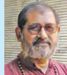
by chhotebhai *

the unfolding events, while others chose to question the farmers for not sticking to the designated route. We also saw some tractors aggressively whirling around to put the cops on the defensive. But largely, considering the numbers, their parade was shorn of violence. They ultimately reached the Red Fort and even hoisted a Sikh religious emblem, the Nishan Sahib, on the flagpole in the forecourt of the Fort. They were subsequently removed by the cops who were now showing much more restraint than earlier.