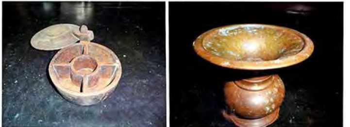
ಆಮ್ಚ್ಯಾ ಮಾಲ್ಹಡ್ಯಾಂನಿ ವಾಪರ್ಲೆಲಿ ವಸ್ತ್ ಹಾಕಾ ಕೊಂಕ್ಣಿಂತ್ ಕಿತೆಂ ಮ್ಹಣ್ತಾತ್?