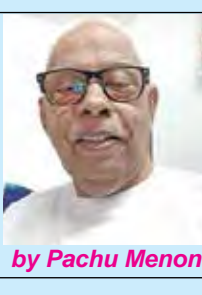
by Pachu Menon

The global pandemic in its wake is expected to turn the world topsy-turvy. Prolonged periods of lockdown have taken their toll on world economies. COV- (Contd.... on Pg. No. 5)