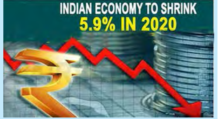
A3. ಬರ್ಶಿ ಆರ್ಥಿಕ ವ್ಯವಸ್ಥಾ

A1 ಭಂಡಾಲ್ ಶಾಹಿ ಆರ್ಥಿಕ ವ್ಯವಸ್ಥಾ A2 ಸಮಾಜ್‌ವಾದಿ ಆರ್ಥಿಕ ವ್ಯವಸ್ಥಾ