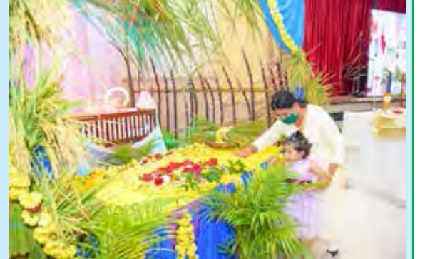
ಮೊಂತಿ ಫೆಸ್ಟ್ ಆಚರಣ್ ಬಿಜೆಯ್