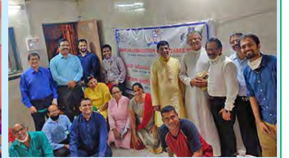
ಮೊಂತಿ ಫೆಸ್ಟ್ ಆಚರಣ್ ಚಿರಿಮೆರಿ, ಮುಂಬಯ್