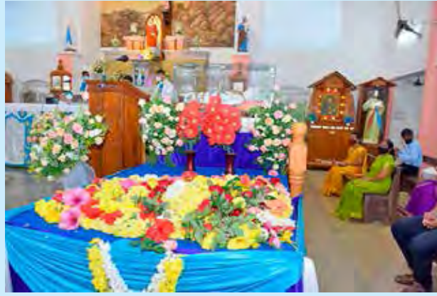
ಮೊಂತಿ ಫೆಸ್ಟ್ ಆಚರಣ್ ಬೊಂದಲ್