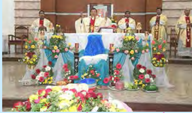
ಮೊಂತಿ ಫೆಸ್ಟ್ ಆಚರಣ್ ಬಜೊಡಿ

ಕೊರೊನಾ ವೈರಸಾಚ್ಯಾ ಕಾಳಾರ್ ಮೊಂತಿ ಫೆಸ್ಟ್ ಗದ್ದಾಳಾಯೆನ್ ನಹಿಂ ತರಿ ಮಾಯಾ ಮೊಗಾನ್ ಆನಿ ಕುಟ್ಮಾ ಯೆಕ್ವೊಟಾನ್ ಸರ್ವಾಂನಿ ಆಚರಣ್ ಕೆಲೆಂ. ಹಾಂಗಾಸರ್ ಥೊಡ್ಯೊ ಮೊಂತಿ ಫೆಸ್ಟ್ ಆಚರಣಾಂಚ್ಯೊ ತಸ್ವೀರೊ