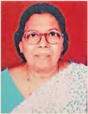
ಊಸಿ ಸಿಕ್ಲೇರಾ, ವಾಕೊಲಾ

ದಿವೊ ಪತ್ರಾಚಿ ಅಭಿಮಾನಿ ಆನಿ ಲೊಕಾ ಮೊಗಾಳ್ ಲೇಖಕಿ ಆಪ್ಲ್ಯಾ ಉತರ್ ಪ್ರಾಯೆರ್ ಹ್ಯಾಚ್ಚೆ ಅಗೋಸ್ಟ್ 23 ತಾರಿಕೆರ್ ದೆವಾದಿನ್ ಜಾಲಿ. ವಾಕೊಲಾಂತ್ ತಿ ಬರೊಚ್ಚೆ ವಾವ್ರ್ ಕರ್ನ್ ಫಾಮಾದ್ ಜಾಲ್ಲಿ. ತಿಕಾ ತ್ಯಾಚ್ ದಿಸಾ ಆಯ್ತಾರಾ ಸಾಂಜೆರ್ 4 ವರಾರ್ ಕಲೀನಾ ಸಿಮಿಸ್ಟ್ರೀಂತ್ ಮಾತಿಯೆಕ್ ಪಾಯ್ಲಿಂ. ದಿವೊ ತಿಚ್ಯಾ ಅತ್ಮ್ಯಾಕ್ ಸಾಸ್ಣಾಚೊ ವಿಶೇವ್ ಮಾಗೊನ್ ತಿಚ್ಯಾ ಭಾವ್-ಭಯ್ಣಿಚ್ಯಾ ತಶೆಂ ಕುಟ್ಮಾಚ್ಯಾ ದು:ಖಾತ್ ವಾಂಟೆಲಿ ಜಾತಾ.