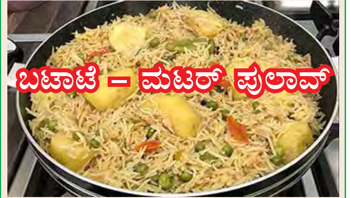
ಬಟಾಣಿ = ಮಟರ್ ಪುಲಾವ್

ಆಜ್ ತುಮ್ಕಾಂ ಬಟಾಣಿ ಆನಿ ಮಟರ್ ಹಾಚೊ ಪುಲಾವ್ ಕಸೊ ಕರ್ಚೊ ಮ್ಹಳ್ಳೆಂ ಸಾಂಗ್ತಾವ್.