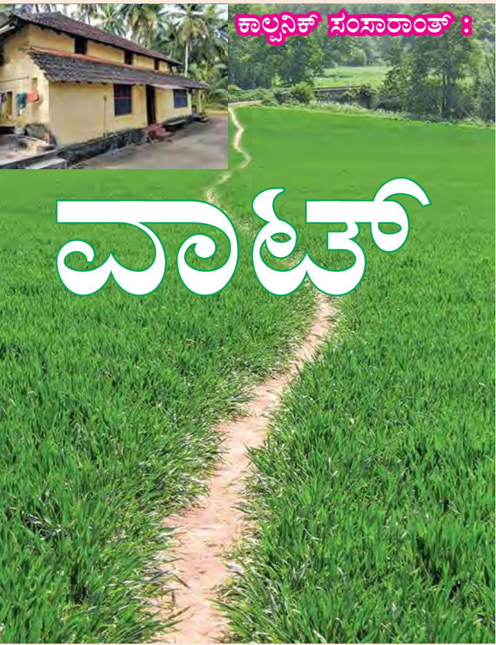
ಕಾಲ್ಪನಿಕ ಸಂಸಾರಾಂತ್ :